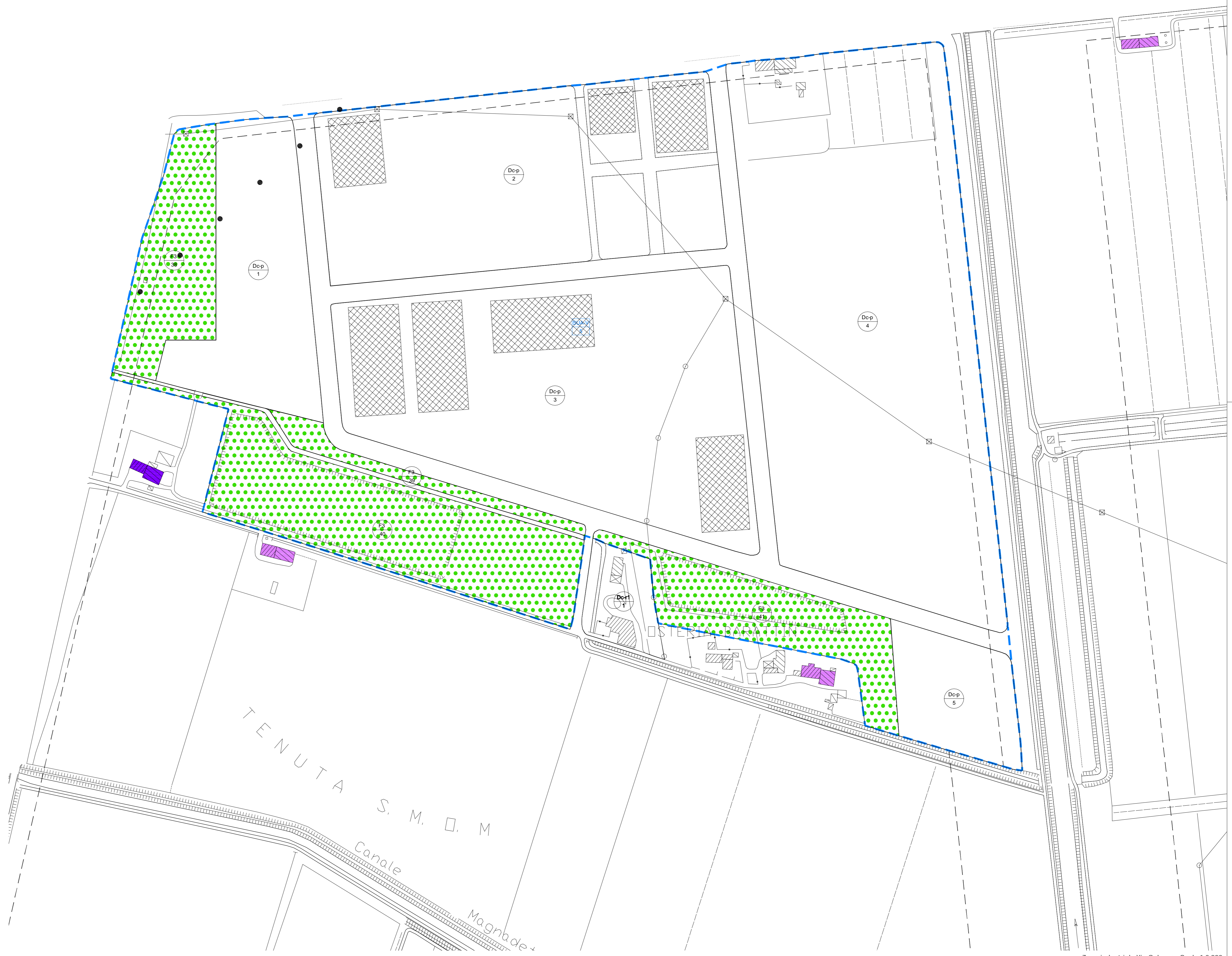
Zona Industriale Via Calnova - Scala 1:2.000